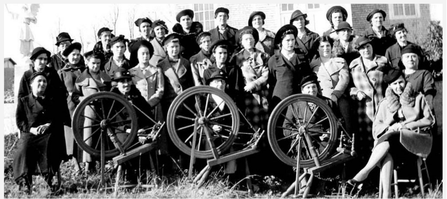
1939, création du premier Cercle de Fermières à Saint-François-d'Assise