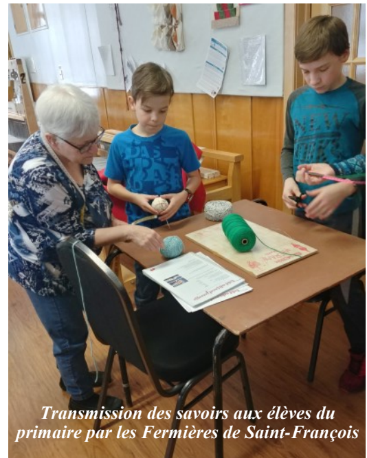
Transmission des savoirs aux élèves du primaire par les Fermières de Saint-François