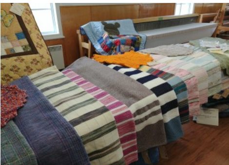
Réalisation des membres du Cercle de Fermières

Créés au milieu des années 30, les Cercles de Fermières 2 étaient présents dans chaque village de Matapédia-et-les-Plateaux pour aider les femmes à réaliser des travaux d'artisanat, surtout le tissage. Les Cercles ne possédant pas de local, c'est donc à la maison que les femmes travaillaient sur un métier qui était ensuite démonté et déplacé dans un autre foyer, tous les mois. Les travaux réalisés (tissus, couvertures, linges à vaisselle,...) servaient à renouveler le linge de maison, mais pouvaient aussi devenir un revenu d'appoint pour la famille. Aussi, la plupart des femmes tricotaient, cousaient, recycloaient des tissus, de la laine (la guenille et la défaite) car, à l'époque, l'argent était rare et il était vital de savoir se débrouiller pour subvenir aux besoins de la famille.