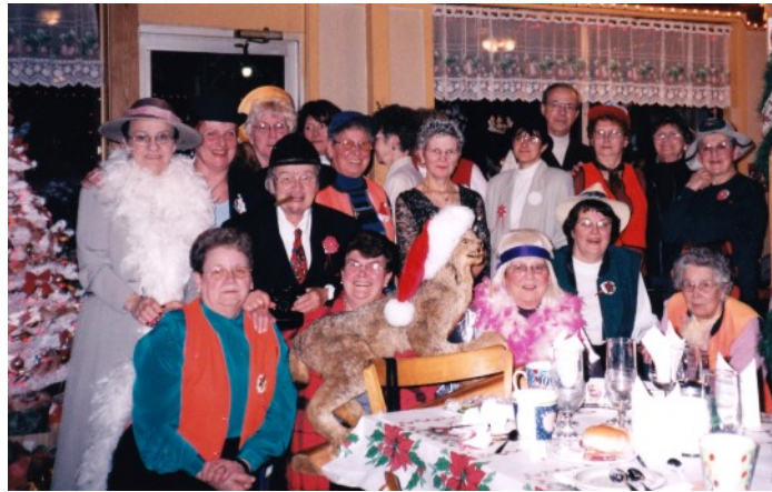
Un Souper de Noël "Meutre et Mystère" Cercle de Fermières de Matapédia