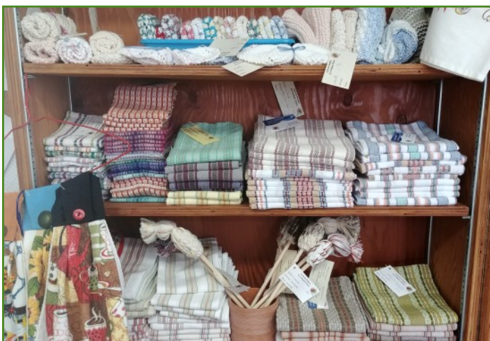
Réalisations des Fermières de Saint-François-d'Assise