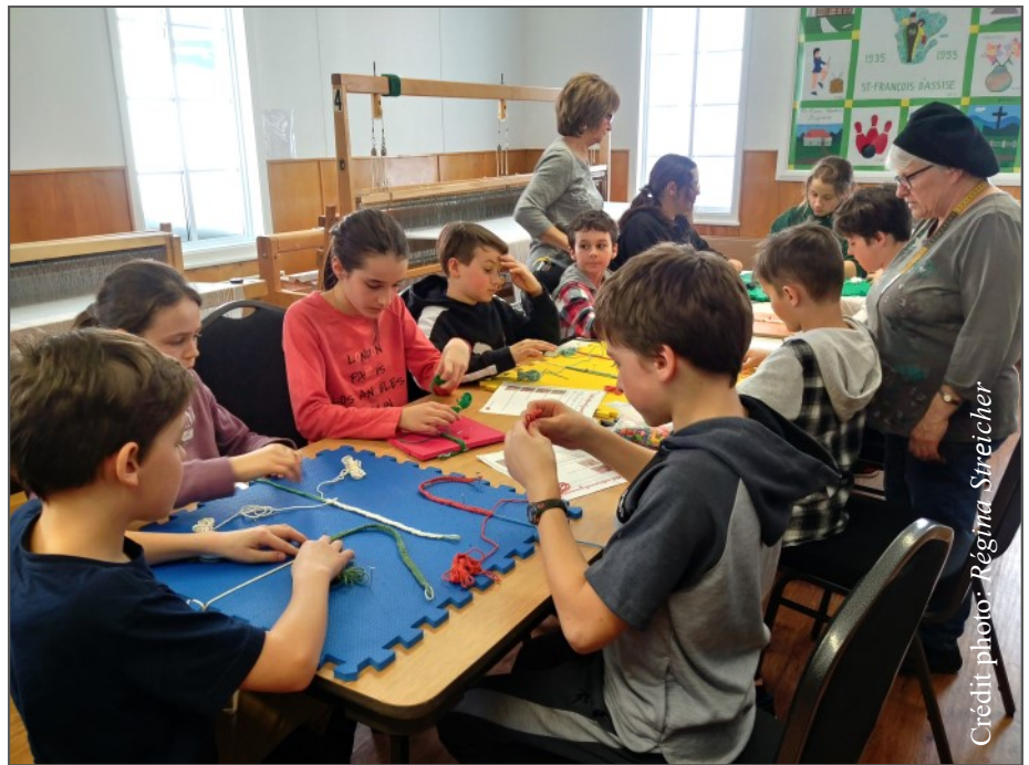
Ateliers réalisés avec des élèves de l'école primaire du Plateau (avant la pandémie)

Aujourd'hui, la moyenne d'âge des Fermières est de plus de 60 ans. Plusieurs d'entre elles ont entre 20 et 30 ans de présence au sein de l'organisme. Malgré les efforts déployés, elles peinent à recruter des jeunes dans leur mouvement. Avec la maman qui travaille souvent à l'extérieur, le rythme de vie des jeunes familles ne laisse pas beaucoup de temps pour des activités collectives. Aussi, les jeunes sont portés à aller chercher l'information sur les réseaux sociaux ou les tutoriels pour trouver des idées de création. Il existe même des