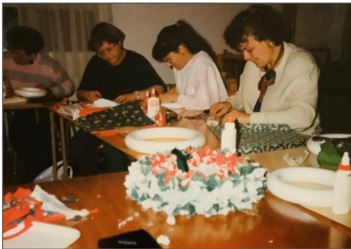
Cercle de Fermières de Matapédia, novembre 1993